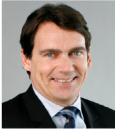
Pierre Karl Péladeau